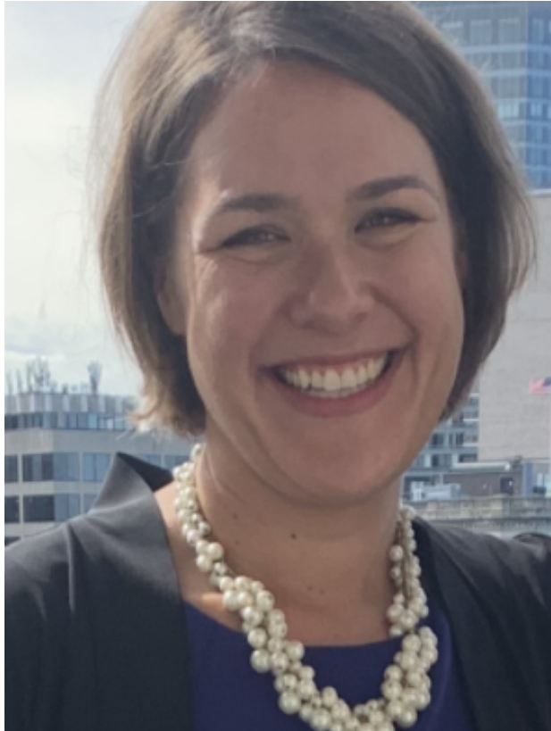
Samantha Aigner-Treworgy Comisionada de EEC